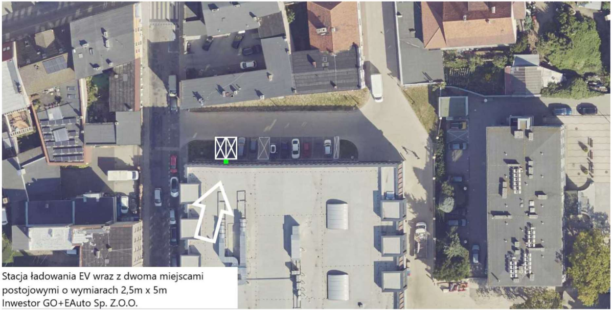
Stacja ładowania EV wraz z dwoma miejscami postojowymi o wymiarach 2,5m x 5m Inwestor GO+EAUTO Sp. Z.O.O.

Zasilenie stacji ładowania z trafostacji obiektu, ułożenie kabla w istniejących korytach kablowych około 90m + 30m dojście do stacji ładowania.